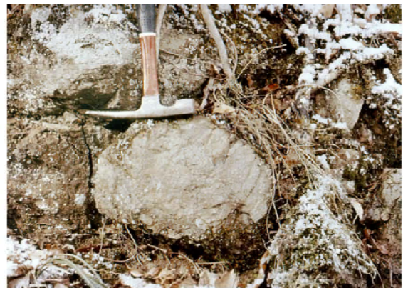
図1 緑色岩の産状(秋吉台北東部産) 海底火山噴火の証拠となる枕状溶岩に由来する。

⑤ 緑色岩・石灰岩の変成作用と上昇・隆起=約2.3億年前(中期トリアス紀末)以降:付加体内部での構造的累重が進むにつれて、付加に伴う変成作用が起こる。その後、上昇・隆起して、美祢層群やより若い地層に不整合におおわれる。(文責:西村祐二郎)